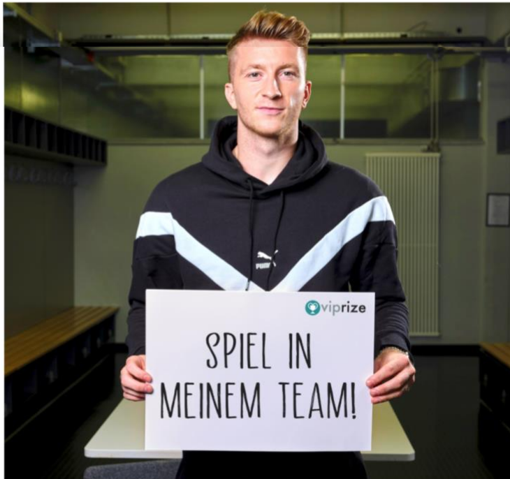
Ist der Schirmherr des Events am 4. Dezember: Einen Platz an der Seite von Marco Reus kann man sich auf viprize.org ergattern.

Ausgerichtet wird das Event von der Spielerberateragentur "SportsTotal" in Kooperation mit der Gamingagentur "Blackbird", die sich zum Ziel gesetzt haben, die Welt des Profi-Fußballs mit der des Gamings zu verbinden, um gemeinsam Gutes zu tun. Das Potenzial der Social-Media-Reichweiten der teilnehmenden Stars aus beiden Szenen solle dafür verknüpft werden.