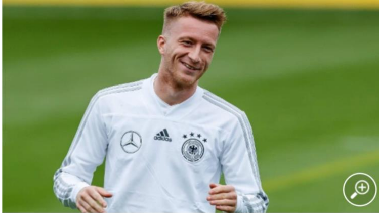
Am 4. Dezember in Köln anzutreffen: Fußballstar Marco Reus.